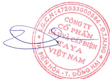
LINH THIN PAU

Tài liệu gửi kèm: Nghị quyết Hội đồng quản trị.